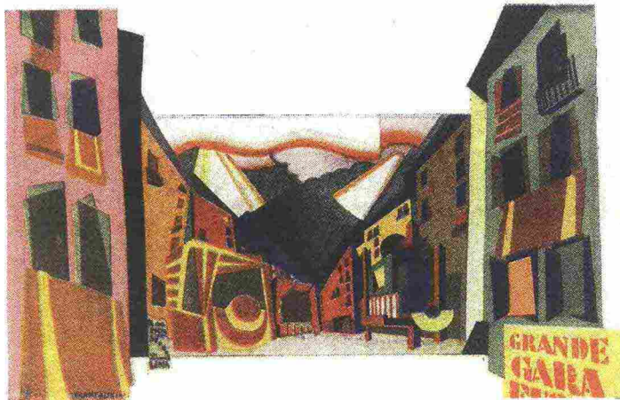
«VULCANI», dipinta di Marinetti - In sintesi l'«Etna nella grande gara del fuoco» - Dinamica di Prampolini